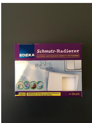
Bezugsquelle empfohlenes Pflege Tuch: